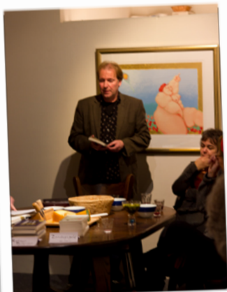
KEA Kunstronde Zondag 13 November 2011